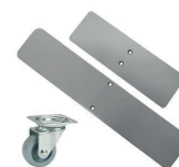
Platte voeten met of zonder wielen