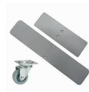
Platte voeten met of zonder wielen